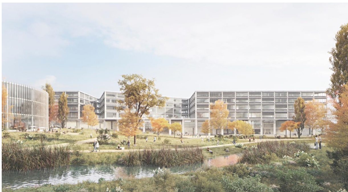
Ab 2026 die Heimat von rund 5000 Studierenden, Dozierenden und Mitarbeitenden der Berner Fachhochschule: Das Projekt «Dreierlei» eines Generalplanerteams unter der Leitung der wulf architekten gmbh aus Stuttgart (D).